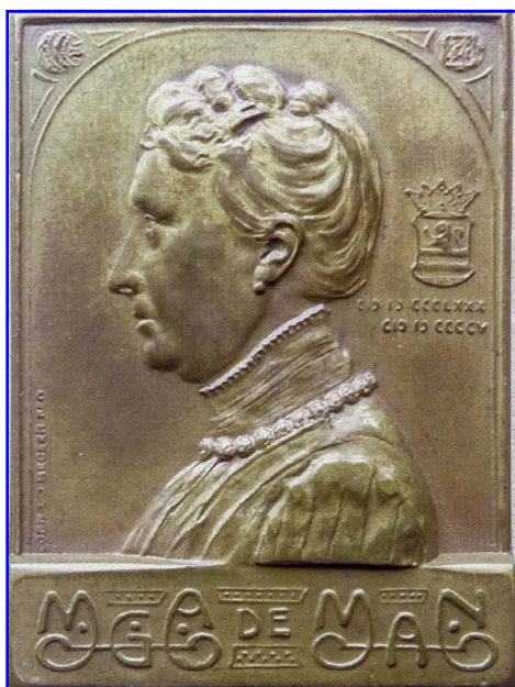
afb. 1. Penning M.G.A. de Man 25 jaar numismate door Corn. L.J. Begeer, messing, 1905. Formaat 4,0 x 3,0 cm. Zeeuws Museum, coll. KZGW, inv.nr. Gm1761.

schen angelot, in het Kon. Kabinet berustende. De opschriften boven sommige vakjes zijn tengevolge van het afbrokkelen van het hout gedeeltelijk uitgewischt, andere zijn overgeschreven, zoodat het niet meer precies te zeggen valt, wat er oorspronkelijk heeft gestaan. Zie hier de namen, die goed leesbaar zijn”.