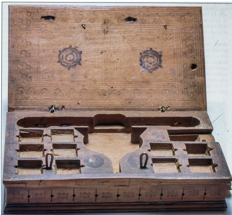
afb. 3. Muntgewichtdoos van Marten Goetbloet, 1614. Geen gewichten in de doos. Collectie Bernisches Historisches Museum, inv.nr. H/33682.

zoals munten, penningen en de muntgewichtdozen, blijft onduidelijk. Een belangrijk deel van haar numismatische collectie had De Man in 1922 en 1923 verkocht aan het Koninklijk Kabinet van Munten, Penningen en Gesneden Steenen. Een klein deel nam zij tijdens haar evacuatie mee