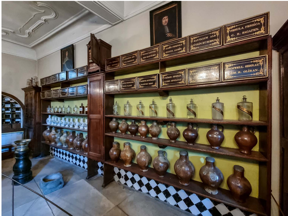
Een sfeerimpressie van de oude apotheek van het hospitaal.

“Oog in oog met de dood” staat stil bij verschillende tijdloze en actuele onderwerpen, zoals afscheid nemen en zingeving. Tegelijk gaat de expositie ook in op het leven en de iconische waarde van Maria en wordt de virtuositeit van Van der Goes belicht. Elk thema is uitgewerkt aan de hand van verschillende topstukken uit de eigen collectie en samengebrachte objecten uit heel Europa. Zo zijn er schilderijen te zien van Memling, Provoost en Albrecht Bouts, maar ook sculptu-