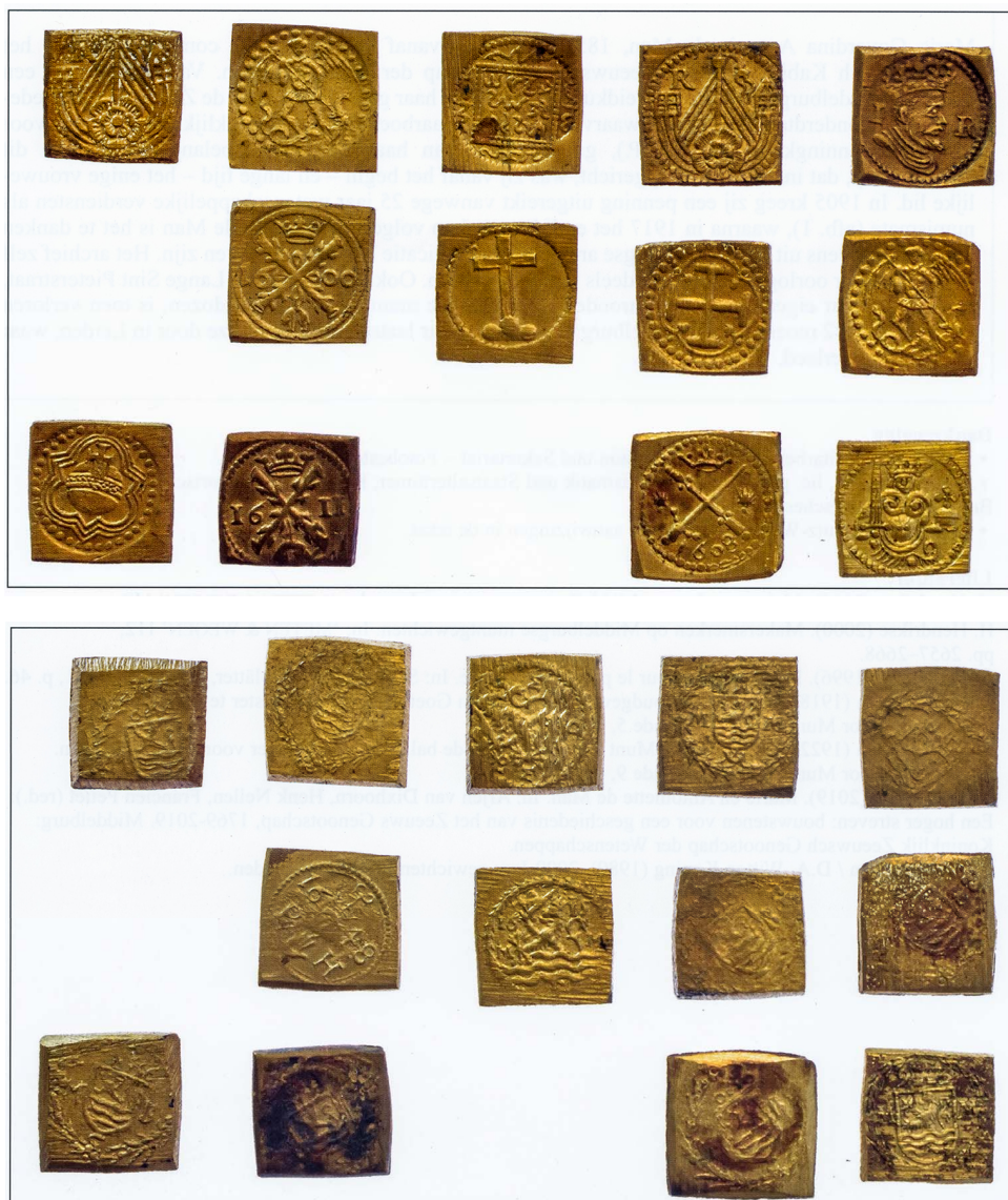
afb. 5. Muntgewichten in muntgewichtdoos Marten Goetbloet, Bernisches Historisches Museum, voor- en keerzijde, inv.nr. H/33682.