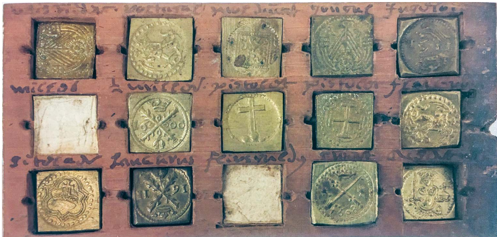
afb. 4. Muntgewichtdoos van Marten Goetbloet, 1614. 13 muntgewichten in de lade. Collectie Bernisches Historisches Museum, inv.nr. H/33682.

Vervolgens schrijft Lavagne dat de initialen MB en 06(1606) aan Maarten du Mont toebehoren. MB moet