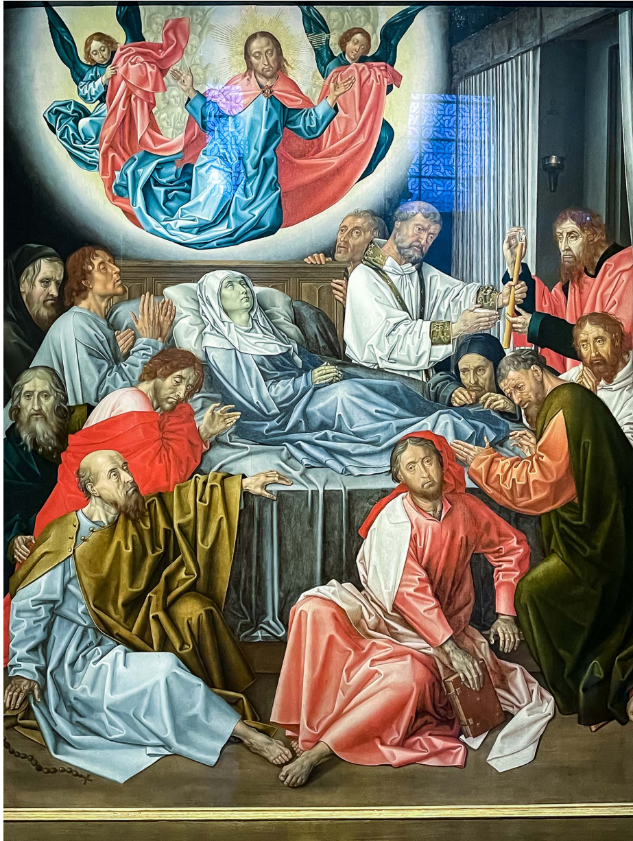
Het schilderij "De dood van Maria" van Hugo van der Goes.