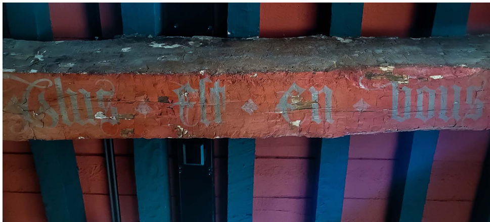
De lijfspreuk van Lodewijk van Gruuthuse: "Plus est en vous".

deel van hun rijkdom aan het bierdrinkende Brugse volk; zij hadden namelijk het "gruutrecht" in leen en mochten belasting innen op lokaal gebrouwen of geïmporteerd bier, het zgn. gruutgeld. Zonder gruuten (salie, gageel, duizendblad en hars) kon je toen water niet drinkbaar maken.