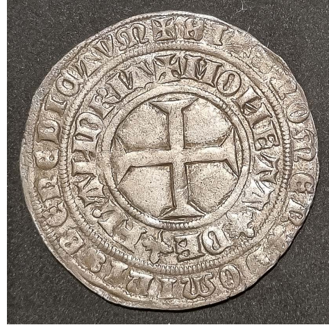
Waarschijnlijk een dubbele groot (leliaert) van Philips de Stoute, 1387-1389, Gent.

oude kant, Chinees porselein en Bourgondische manuscripten. En ja, we zien er zelfs een bruikleen van Erfgoed Zeeland: de fraaie Syrische kan die in Sluis is gevonden! Indrukwekkend is de fraaie 15e-eeuwse bidkapel die de verbinding maakt tussen het paleis en de Onze-Lieve-Vrouwekerk, met zicht op het gotische koor. De heren van Gruuthuse konden vanaf deze comfortabele plek de dienst vanuit hun paleis bijwonen.