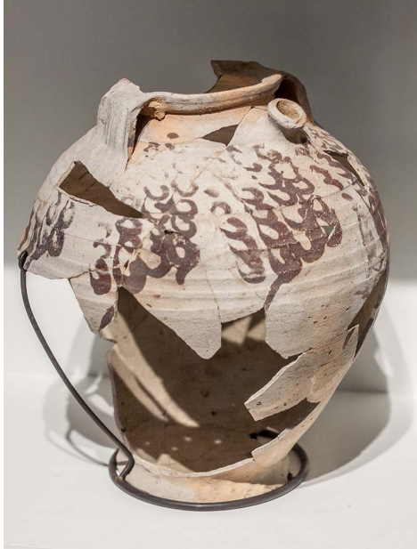
Een Pingsdorf tuitpot in roodbeschilderd aardewerk (1050-1125), ontdekt langs de Brugse Steenweg in Koolkerke. (4 km ten noordnoordoosten van het Belfort in Brugge).

oude kant, Chinees porselein en Bourgondische manuscripten. En ja, we zien er zelfs een bruikleen van Erfgoed Zeeland: de fraaie Syrische kan die in Sluis is gevonden! Indrukwekkend is de fraaie 15e-eeuwse bidkapel die de verbinding maakt tussen het paleis en de Onze-Lieve-Vrouwekerk, met zicht op het gotische koor. De heren van Gruuthuse konden vanaf deze comfortabele plek de dienst vanuit hun paleis bijwonen.