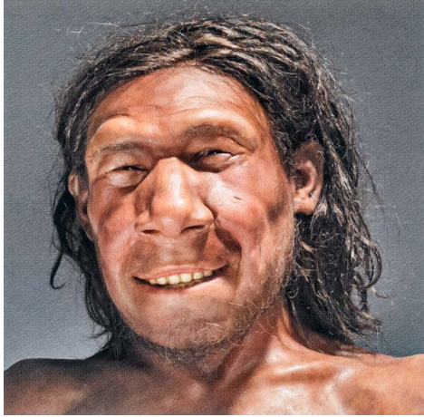
Reconstructie van Krijn, de eerste Neanderthaler van Nederland.

Er is een enorm archief uit deze verdronken wereld aan de Engelse kust. In 2013 werden voetafdrukken van een familiegroep van 950.000 jaar geleden gevonden in de klei van het estuarium, een voorloper van de Thames.