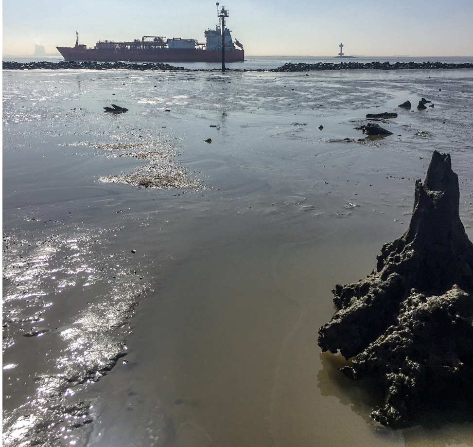
(Verdronken land van Oud-Rilland)