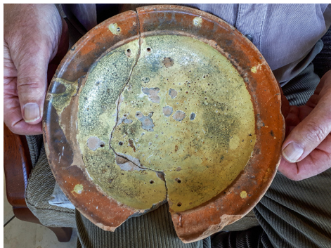
Bord met uitgeboorde gaatjes.

voor hem waardevolle bord nog een poosje te kunnen gebruiken.