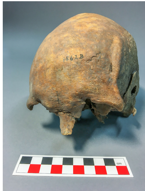
Fig 4. Schedel 1562 B van een volwassen man, gevonden op het terrein van Slot Haamstede, uit het Zeeuws Archeologisch Depot. De dikke richel rechts boven de linker wenkbrauw, en de smalle, langwerpige opening links daarvan zijn sporen van een genezen houwwond. De man is dus zwaar gewond geraakt door een slag met een bijl of zwaard, maar heeft dit overleefd.

en Dijkmeester het grafveld in de 9de eeuw plaatsten. Zeker was dat de begravingen moesten dateren van ná de Romeinse tijd. Uit het nieuwe onderzoek bleek dat rond de graven aardewerk uit de Vroege Middeleeuwen aan het licht was gekomen, zodat de hoop bestond dat deze dateerbaar