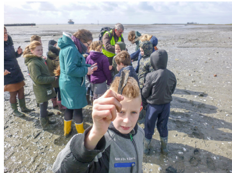
Een leerling vindt een botfragment en toont het aan de fotograaf.

De afspraak was al snel gemaakt. Op vrijdagmiddag 5 april liep ik gekleed als een middeleeuwse zoutzieder, de school in. Aan groep 5/6 en 7/8 die gezellig samen in een lokaal zaten mocht ik een gastles archeologie geven. Als zoutzieder legde ik eerst uit wat mijn beroep eigenlijk inhield. Aangezien er maar één groep meegegaan was, vertoonde ik een Power-Point-presentatie van een wandeling