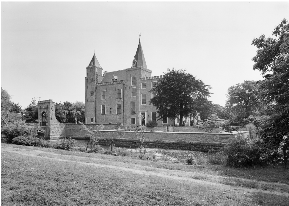
Fig. 1. Slot Haamstede gezien vanuit het noordwesten. Negatief nr. 198.187 van de Rijksdienst voor het Cultureel Erfgoed (RCE). Fotografie G.J. Dukker, september 1978.

nog veel verder terug. Bij Brabers, een inmiddels afgegraven hoger gelegen terrein ca. 1500 m zuidoostelijk van Haamstede, is in 1956 en 1957 vluchtig archeologisch onderzoek verricht, vlak vóór de graafmachines van de herinrichting uit. Deze herinrichting werd noodzakelijk geacht na de inundatie van Schouwen-Duiveland aan het eind van de Tweede Wereldoorlog en de Watersnoodramp van 1953. Op Brabers is bewoning aangetoond uit de periode 3100-2900 voor Christus (Nieuwe Steentijd), al is onzeker of deze bewoning permanent was of