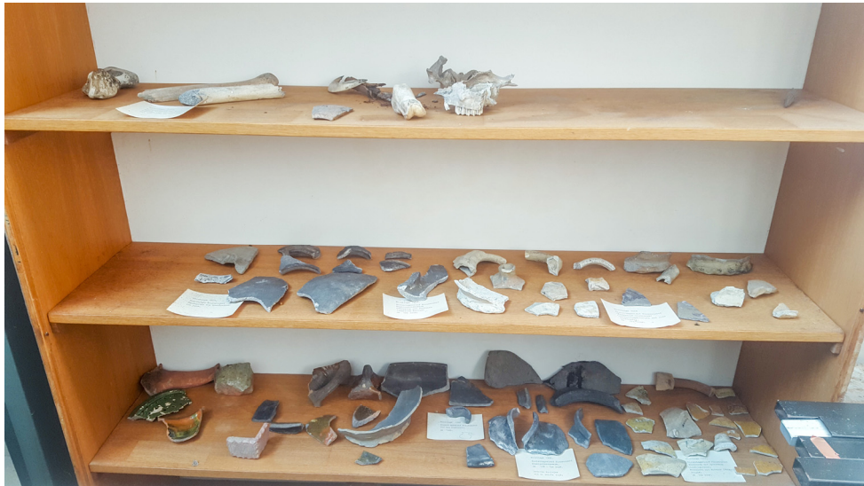
Overzicht selectie vondstmateriaal met oude kaartjes uit 1973. Jarenlang te zien in de toren van de Geerteskerk te Kloetinge.

gevogelte, rund, schaap, varken en een schedel van een paard, alsook een spinsteentje en een glis. Daar moet ook een leerbewerker zijn vak hebben uitgeoefend; diep in de oude mestlagen werden verfresten, veel leerresten en paardentuig gevonden. Bijzonder was een linkerschoentje uit ca. 1300, gemaakt van zacht leer, een fraai versierd vrouwenlaarsje! In de Peperstraat kwamen enkele kannen van roodbakkend aardewerk met slibversiering, dat. ca. 1300-1400, uit een gemetselde waterput te voorschijn. De laatste tijd wordt de toren alleen gebruikt als opslagruimte. De ruit van de vitrinekast was gebroken en de