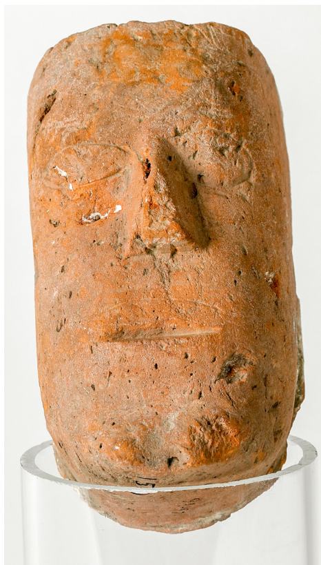
Afb. 1. Gebakken steen van rode aarde, waarop in grove trekken een "mensen gelaat" is ingesneden.

delijk deel van dat eiland om grond te verkrijgen ten einde daarmede den zeedijk te herstellen, die even als in vroegere tijden ook nu nog in hooge mate door de zee bedreigd wordt, en tot wiens bescherming men in 1829