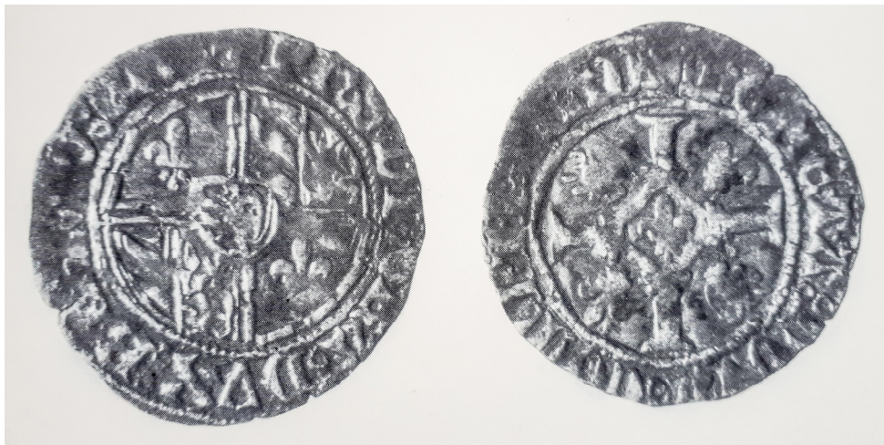
Afb. 2. Het “Negenmanneke”, een benaming voor de kwart groot in de Zuidelijke Nederlanden; het betreft een kleine munt van zilver uit de periode 1434-1467. Sinds de 14e eeuw is de duit voornamelijk in de Noordelijke Nederlanden de benaming van munten van 1/4 groot (of 1/8 stuiver). In Vlaanderen en Brabant werden deze munten veelal zesken of negenmannekes genoemd, omdat zij overeenkwamen met zes Vlaamse of negen Brabantse mijten.