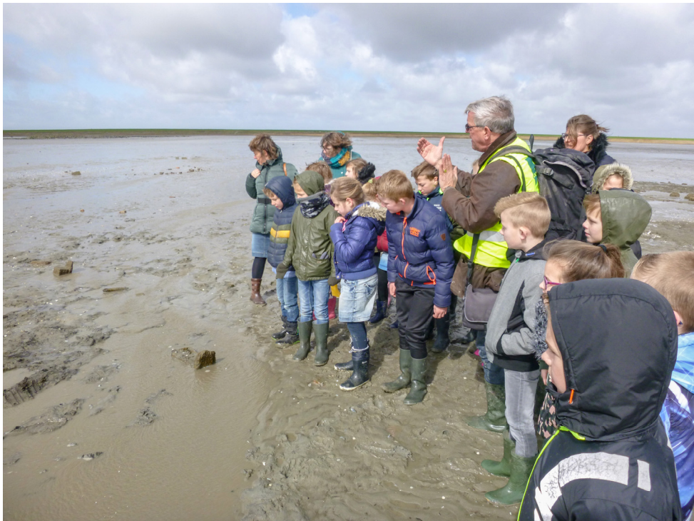
Leerlingen van de Basisschool De Zandbaan op de slikken in de Westerschelde bij de resten van het verdronken oude Rilland.

voorschijn gekomen oude landschap en de bewoningsresten. Daarom wordt er dit jaar gestart met een nieuwe vooroeverversteviging in de vorm van strekdammen. Daardoor zal er weer een dikke sliblaag komen op wat nog rest van het verdronken land bij de Middenketel, evenals destijds bij Valkenisse gebeurde na de aanleg van de strekdammen. Om ook de jeugd van het “nieuwe Rilland” nog eens te betrekken bij de historie van hun dorp hebben we de