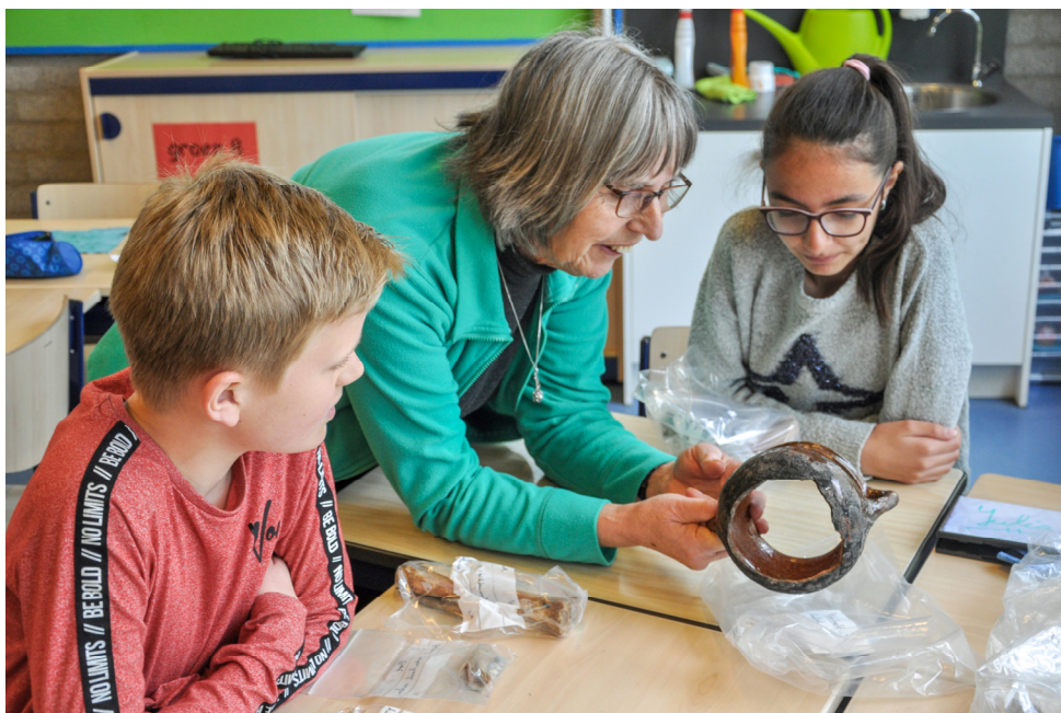
Archeologieles op de O.B.S. “De Reigersberg”.