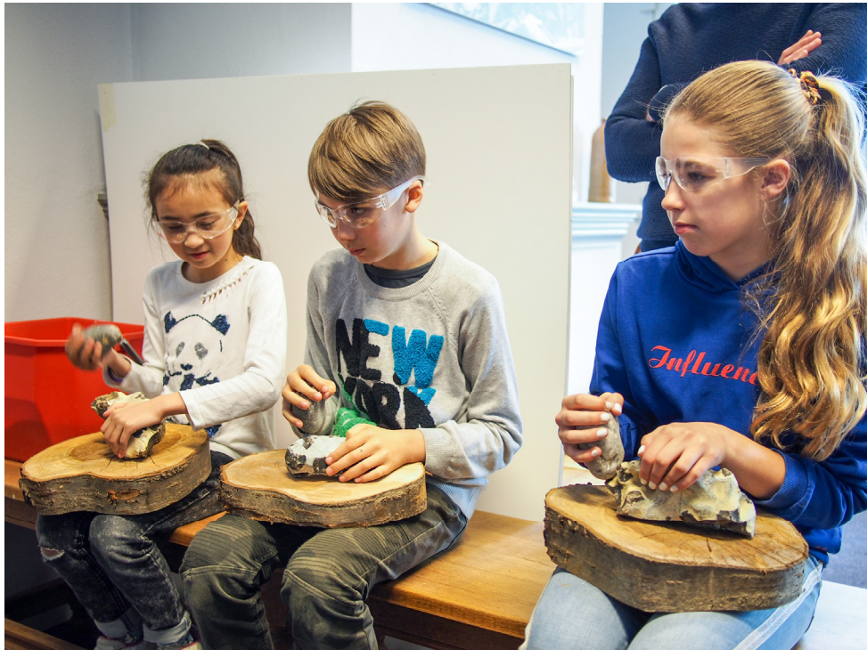
Jongeren mogen vuursteen bewerken tijdens de archeologielessen bij de WAH in Hulst.

daar sinds enkele maanden nu ook een educatief centrum voor schoolkinderen ingericht. De doelgroepen zijn de scholieren van ongeveer 10 tot 14 jaar: de groepen 7 en 8 van het basisonderwijs en de klassen 1 en 2 van het middelbaar onderwijs. De kinderen maken er kennis met verschillende facetten van de archeologie. Daarbij staat voorop dat het om doe-activiteiten moet gaan.