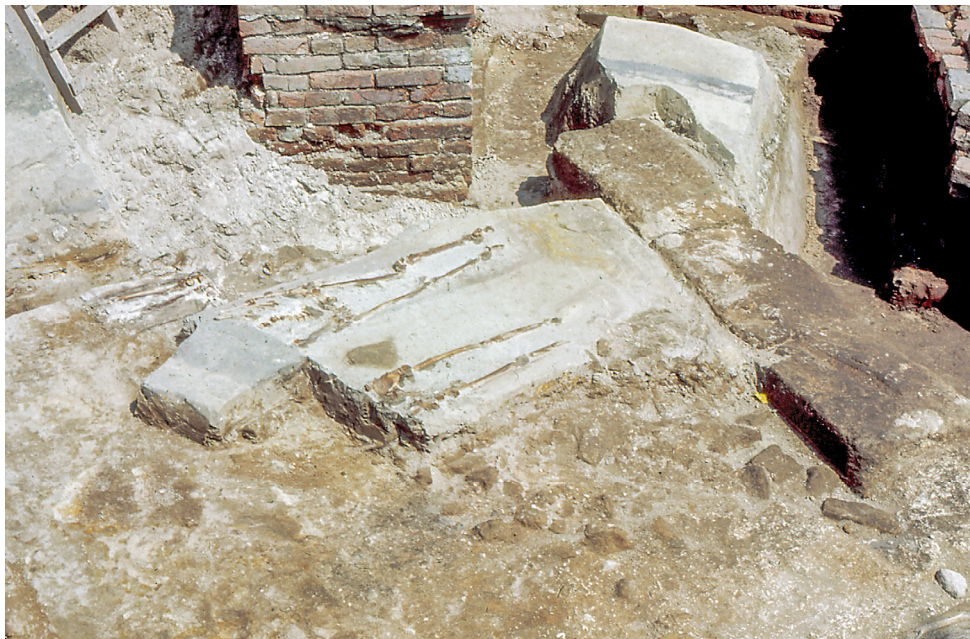
Fig. 3. De noordoostelijke hoek van het Sloteland tijdens de opgravingen in juli 1964, gezien vanuit het zuidwesten. Zichtbaar zijn het stuk Romeinse muur van grote tufsteenblokken en delen van enkele skeletten. Negatief KB 583:4/dia 6435 van de RCE. Fotograaf L.B (L Breijer?), juli 1964.

eerste muurdeel bestaat uit twee zeer grote blokken tufsteen die bij elkaar ruim 2.5 m lang zijn (zie fig. 3 rechts). Het noordelijke blok (achter) is meer dan een meter lang en bijna 0.70 m breed, het zuidelijke is liefst 1.50 m lang en maximaal 0.63 m breed. Het is onduidelijk of het noordelijke blok compleet was, het zuidelijke was dat zeker.