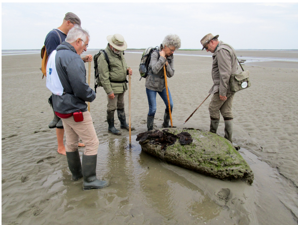
Leden van de WAH bekijken een aangespoelde veenbonk.

Een deel van het voorjaar werd in beslag genomen door de voorbereiding van de tentoonstelling 'Vechten tegen de Bierkaai' in het museum 'De Vier Ambachten'. Een unieke collectie militaria, rijk becommentarieerd, werd van juli tot november bezocht door vele geïnteresseerden. Zeker