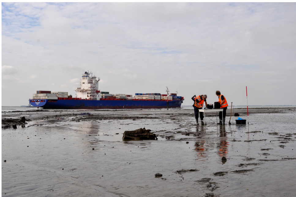
(Archeologen van Erfgoed Zeeland op Oud-Rilland)

(Thermenmuseum Heerlen)