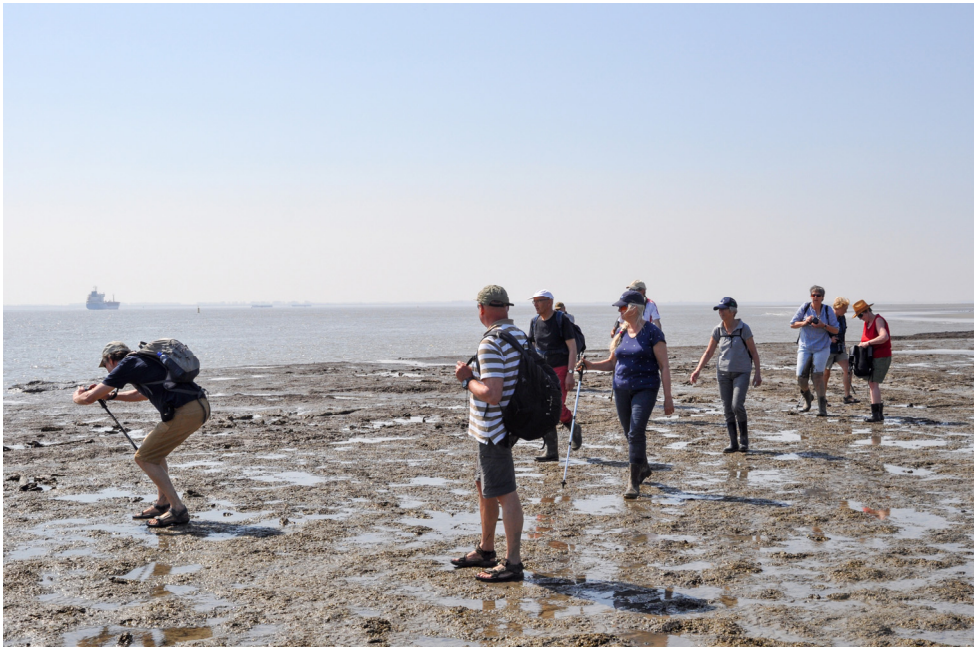
Eén van de laatste rondwandelingen op het verdrinken land van Oud-Rilland, een fascinerende plek!