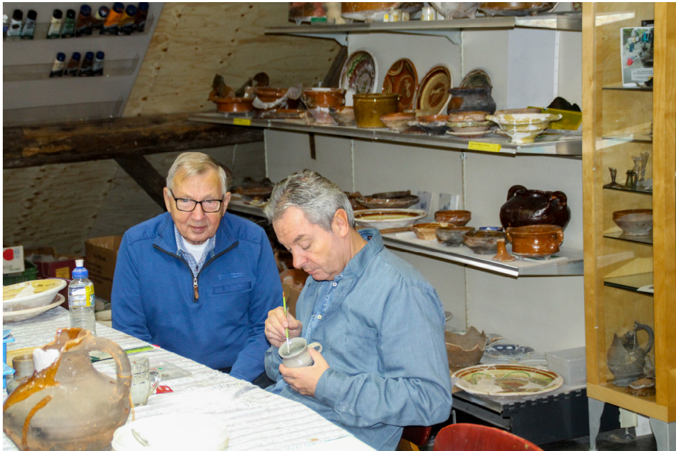
Leden van de werkgroep aan het werk in het Heemhuis te Halsteren.

We hebben naast de vele al samengestelde stukken keramiek nog zo'n 100 bananendozen te gaan, wat naar schat-