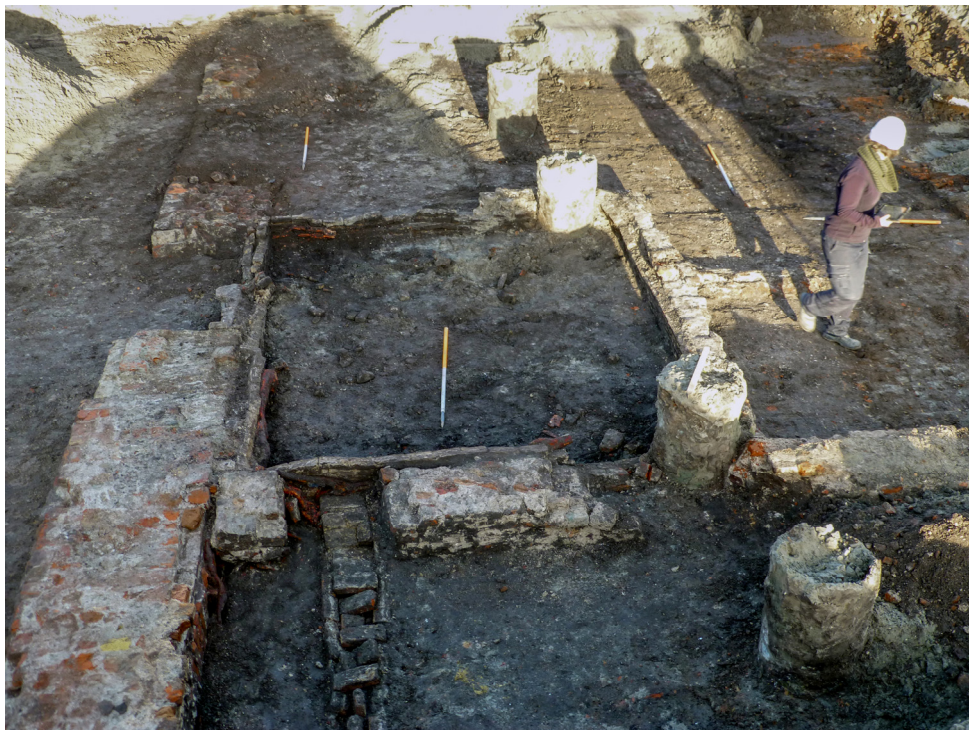
Blootgelegde fundamente van de kloosterkerk van de Minderbroeders op het 's-Gravenhofplein in Hulst.

Maandagochtend vinden we spijkers en enkele knopen. 's Middags weer tientallen spijkers en wat kleine losse stukjes metaal, vooral in de noordwesthoek van de opgraving. Ook komt er wat aardewerk te voorschijn, waaronder grijsbakkend aardewerk. Er worden twee plaatsen zichtbaar, ongeveer zo groot als een beerput, waar blijkbaar puin in was gestort. Deze zijn wel omcirkeld maar niet verder uitgegraven.