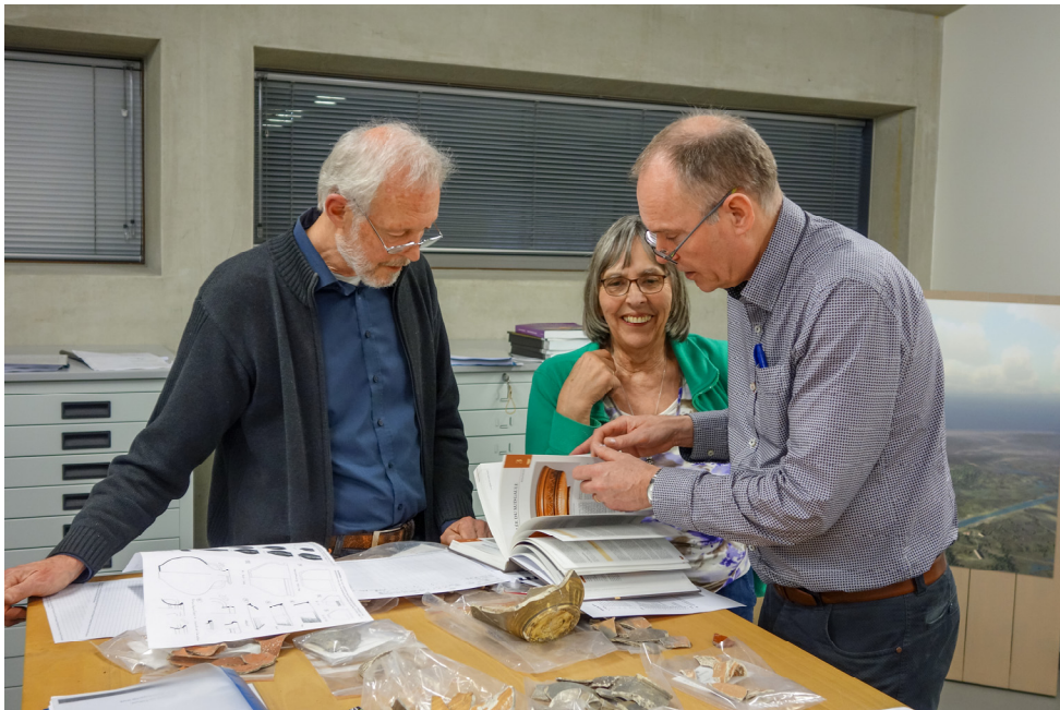
Romeins aardewerk determineren is vooral zoeken in boeken!

teel Sandenburgh in Veere (boringen, weerstandsmeting). Door de Gemeente Goes werd begeleiding gevraagd bij graafwerkzaamheden voor nieuwbouw aan de Voorstad in Goes en bij de aanleg van de spooronderdoorgang. Voor het Stadhuismuseum in Zierikzee zijn scherven gewassen, is 2 keer gewerkt aan een educatief project en is 19 keer verder gewerkt aan de archeologische catalogus. De WAD assisteerde 4 keer de archeologen van Artefact in Hulst en verleende 4 keer hulp bij het sorteren en bij het invoeren in de database bij Artefact in