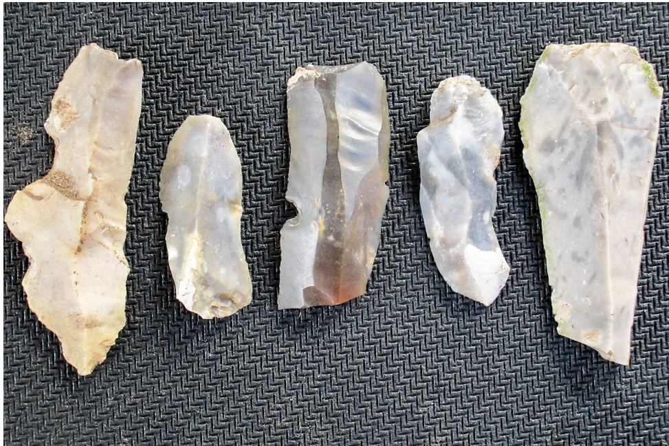
Vuurstenen artefacten van de akker aan de Emmabaan in Koewacht.

16/5: Veldonderzoek dekzandrug Marlemontse Plaat Saeftinghe Juni: Onderzoek en restauratie museumkanon Mei-Aug: Voorbereiding educatie- project Juni-Nov: Tentoonstelling 'Vechten tegen de Bierkaai' 31/8: Onderzoek rosmolen Klooster- zande Lange Nieuwstraat 19/9: Veldonderzoek Emmabaan Koewacht vuursteenvondsten 29/9: Archeo-workshop erfgoeddag BC Saeftinghe