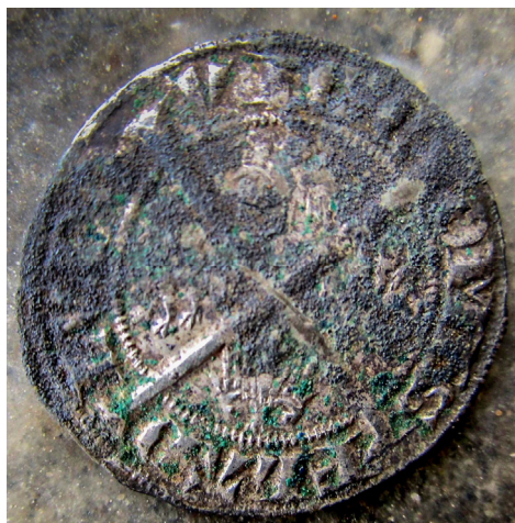
Detectorvondst: de voor- en achterzijde van een Zeelandia muntje.