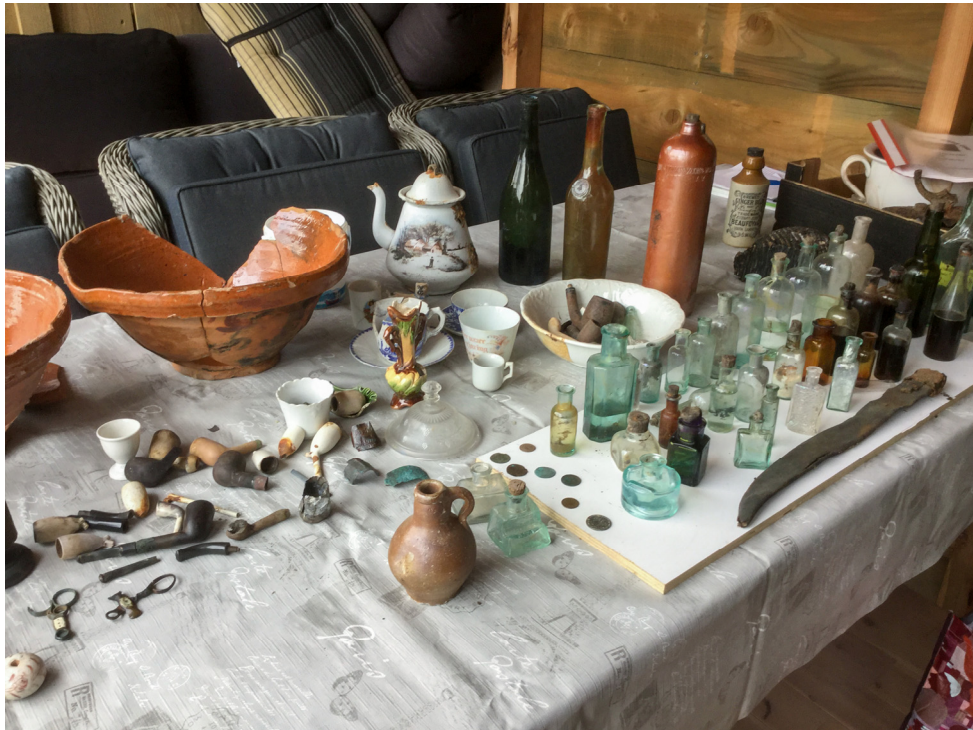
Een overzicht van de vondsten geborgen uit enkele putten van twee oude huisjes in het centrum van Waarde.

intussen verwerkt door Hans Jongepier in Archis 3 en in het ZAA van Erfgoed Zeeland.