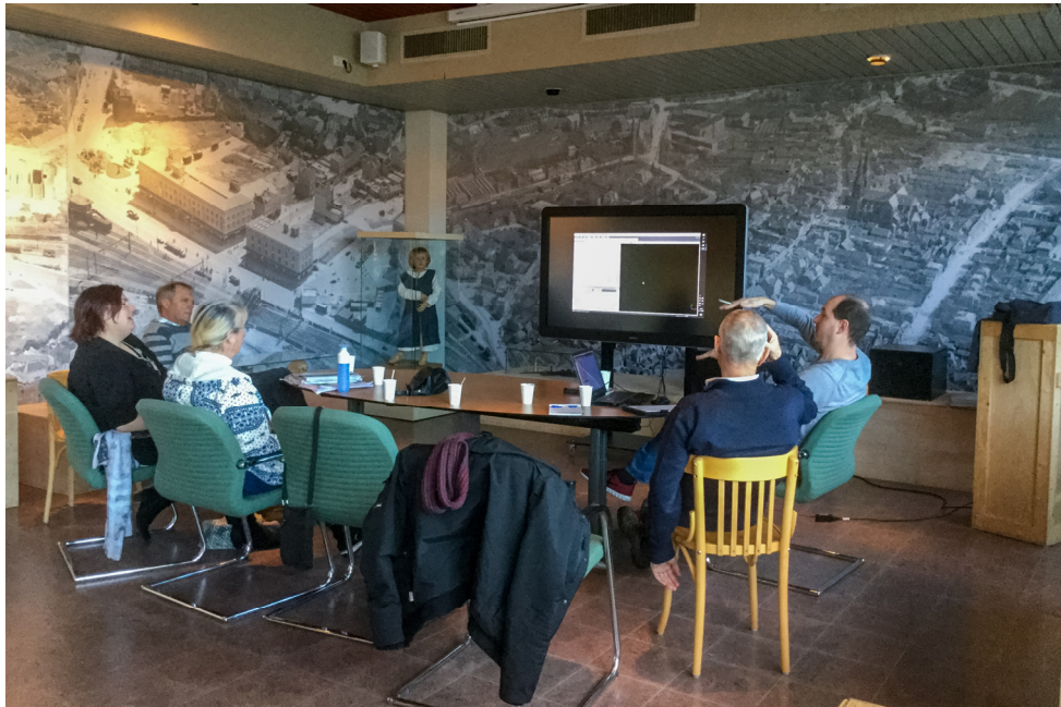
De presentatie van de meettechnieken op Sandenburgh in Veere en op een akker in Colijnsplaat door de WIMA in Eindhoven.

Op 13 november 2018 werden de contouren van het kasteel met speciale apparatuur in beeld gebracht. Dit onderzoek is een onderdeel van een project van de WAD om Veere, zoals het er uitzag in de middeleeuwen, in 3D vast te leggen. De bedoeling is dat bezoekers later met een virtual realitybril door de straten van Veere kunnen wandelen. Als onderdeel van dit project werd nu ook het kasteelterrein gescand met deze grondradar.