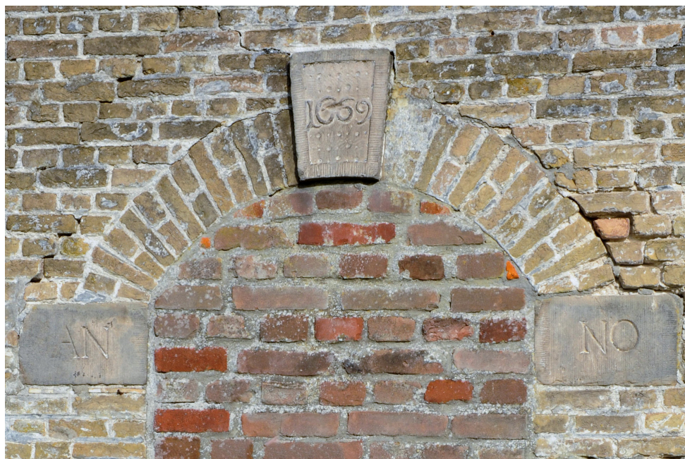
De gevelstenen van de gesloopte boerderij De Lantaarn bij Steenberg.

Wij zijn nauw betrokken bij het bouwtechnisch en archeologisch onderzoek. Onze stichting maakt een verslag met beschrijving, foto’s en tekeningen van het gebouw. Een sluitsteen boven een doorgang in de gevel met het jaartal 1669 krijgt een plekje in de nieuwbouw die in de loop van 2019 zal worden voltooid. Verder krijgen delen van het gebouw die het waard zijn om behouden te worden,